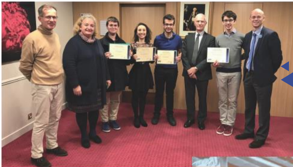
Versailles : bourses de Scolarité Classes préparatoires

POUR ATTEINDRE NOS OBJECTIFS nous avons besoin de 2 M€ de dons et de legs en 2019.